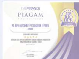
Penghargaan dari THE FINANCE tahun 2019 kategori aset 25 M sampai dengan 100 M tumbuh pesat selama 3 tahun