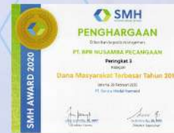
Penghargaan dari SMH tahun 2020 kategori dana masyarakat terbesar tahun 2019