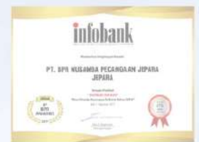
Penghargaan dari INFOBANK kinerja tahun 2016 dengan predikat SANGAT BAGUS