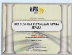
Penghargaan dari INFOBANK kinerja tahun 2010 dengan predikat SANGAT BAGUS