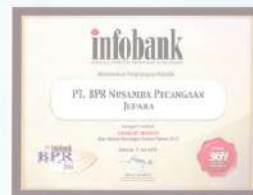
Penghargaan dari INFOBANK kinerja tahun 2013 dengan predikat SANGAT BAGUS