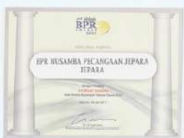
Penghargaan dari INFOBANK kinerja tahun 2010 dengan predikat SANGAT BAGUS