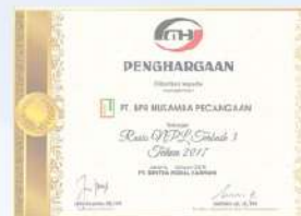
Penghargaan dari SENTRA MODAL HARMONI Rasio NPL Terbaik 3 kinerja tahun 2017