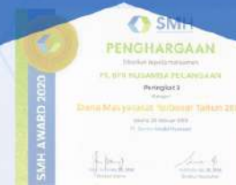
Penghargaan dari SMH tahun 2020 kategori dana masyarakat terbesar tahun 2019