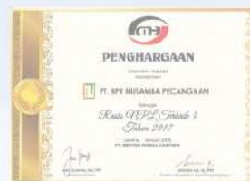
Penghargaan dari SENTRA MODAL HARMONI Rasio NPL Terbaik 3 kinerja tahun 2017