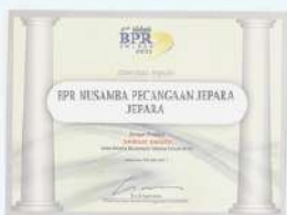
Penghargaan dari INFOBANK kinerja tahun 2010 dengan predikat SANGAT BAGUS