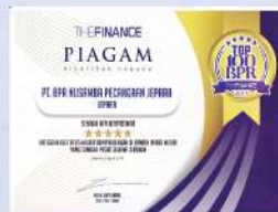
Penghargaan dari THE FINANCE tahun 2019 kategori aset 25 M sampai dengan 100 M tumbuh pesat selama 3 tahun