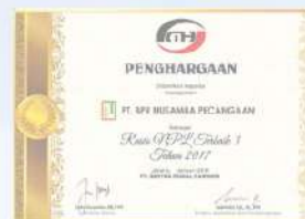
Penghargaan dari SENTRA MODAL HARMONI Rasio NPL Terbaik 3 kinerja tahun 2017