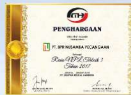
Penghargaan dari SENTRA MODAL HARMONI Rasio NPL Terbaik 3 kinerja tahun 2017