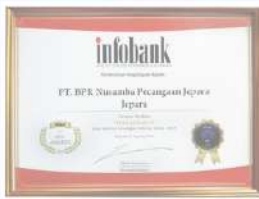
Penghargaan dari INFOBANK kinerja tahun 2018 dengan predikat SANGAT BAGUS