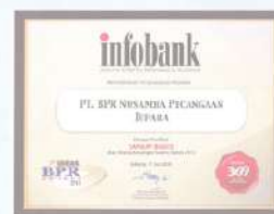
Penghargaan dari INFOBANK kinerja tahun 2013 dengan predikat SANGAT BAGUS