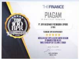
Penghargaan dari THE FINANCE tahun 2018 kategori aset 25 M sampai dengan 100 M tumbuh pesat selama 3 tahun