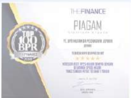
Penghargaan dari THE FINANCE tahun 2018 kategori aset 25 M sampai dengan 100 M tumbuh pesat selama 3 tahun