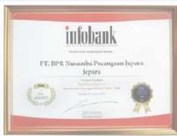
Penghargaan dari INFOBANK kinerja tahun 2018 dengan predikat SANGAT BAGUS