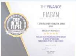
Penghargaan dari THE FINANCE tahun 2018 kategori aset 25 M sampai dengan 100 M tumbuh pesat selama 3 tahun