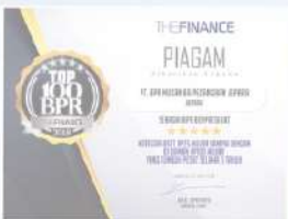
Penghargaan dari THE FINANCE tahun 2018 kategori aset 25 M sampai dengan 100 M tumbuh pesat selama 3 tahun