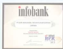
Penghargaan dari INFOBANK kinerja tahun 2012 dengan predikat SANGAT BAGUS