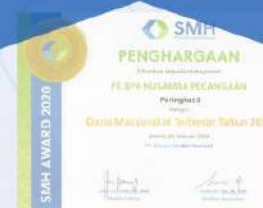
Penghargaan dari SMH tahun 2020 kategori dana masyarakat terbesar tahun 2019