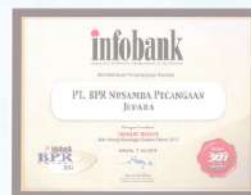
Penghargaan dari INFOBANK kinerja tahun 2013 dengan predikat SANGAT BAGUS