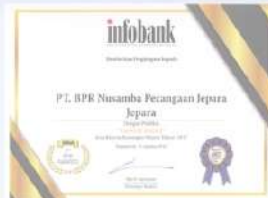
Penghargaan dari INFOBANK kinerja tahun 2017 dengan predikat SANGAT BAGUS