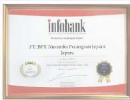
Penghargaan dari INFOBANK kinerja tahun 2018 dengan predikat SANGAT BAGUS