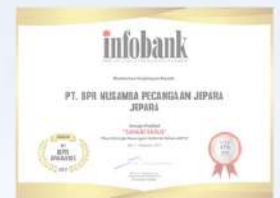
Penghargaan dari INFOBANK kinerja tahun 2016 dengan predikat SANGAT BAGUS