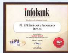
Penghargaan dari INFOBANK kinerja tahun 2013 dengan predikat SANGAT BAGUS