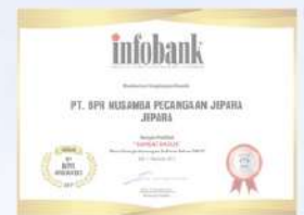
Penghargaan dari INFOBANK kinerja tahun 2016 dengan predikat SANGAT BAGUS