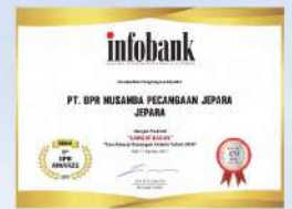
Penghargaan dari INFOBANK kinerja tahun 2016 dengan predikat SANGAT BAGUS