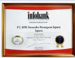
Penghargaan dari INFOBANK kinerja tahun 2018 dengan predikat SANGAT BAGUS

Melalui penerapan prinsip prinsip Tata Kelola Perusahaan secara konsisten, PT. BPR Nusamba Pecangaan akan senantiasa meningkatkan nilai dan manfaat bagi pemegang saham dan pemangku kepentingan