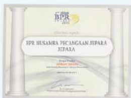
Penghargaan dari INFOBANK kinerja tahun 2010 dengan predikat SANGAT BAGUS