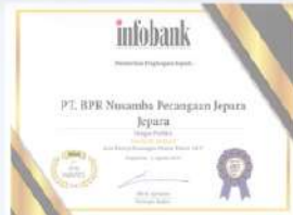
Penghargaan dari INFOBANK kinerja tahun 2017 dengan predikat SANGAT BAGUS