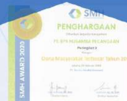
Penghargaan dari SMH tahun 2020 kategori dana masyarakat terbesar tahun 2019