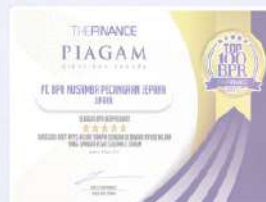
Penghargaan dari THE FINANCE tahun 2019 kategori aset 25 M sampai dengan 100 M tumbuh pesat selama 3 tahun