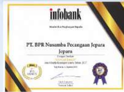
Penghargaan dari INFOBANK kinerja tahun 2017 dengan predikat SANGAT BAGUS